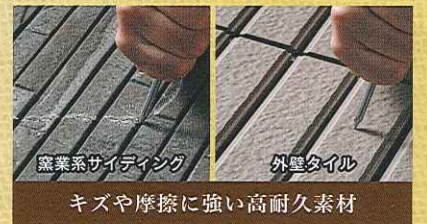
窯業系サイディング

高級感と重厚さが魅力の外壁タイル。凹凸のある柔らかな表情が、住まいに温もりを感じさせます。和風から洋風、モダンスタイルまで幅広いテイストに似合う外壁材です。