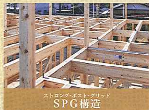
ストロングポイントグリッド SPG構造

通し柱で1階部と2階部を強固につなぐ「SPG構造」と、壁・床・天井の6面で建物を支える「モノコック構造」。これらの2つの構造の利点を融合させたのが「プレミアム・ハイブリッド構法」です。