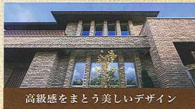
高級感をまとう美しいデザイン

窯業系サイディングなど一般的な外壁材の場合、およそ10年ごとに塗り替えが必要になります。外壁タイルなら塗り替えはならず、基本的に洗浄などのメンテナンスのみ。長期的に見てコストを抑える賢い住まいづくりを実現します。